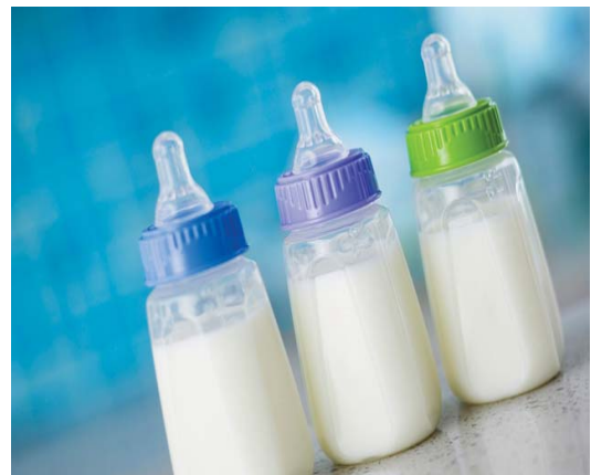
NUEVAS LEYES ESTATALES PROTEGEN A LOS CONSUMIDORES